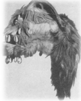
Resim 2. Şamanın baş giysisi. Altaylılar. MAE, No.1853-2.

G. N. Potanin rahip M. Çelkov'un beyanına göre eskiden Teleüt şamanlarının baş giysisi olarak puhu kuşunun yekpare derisini kullandıklarını bildirmektedir (Potanin 1881-1883; Prokofyeva 2014). Şaman bu başlık ile ayın içinde kuş donuna girer, gökyüzü (yukarı, parlak) ve karanlık (yeraltı) dünyalarına seyahat eder, oralarda ruhlarla görüşürmüş. Yine Hakas kabilelerinden Kaçin, Sagay ve Kızıl şamanları da baş giysilerinin tepesine bir tutam kuş teleği taktıkları, bu teleklerin ya tepede dik olarak durdukları ya da serbest şekilde enseye salındıkları bildirilmektedir (Resim 3, 4: Prokofyeva 2014:72).