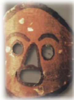
Resim 8. Kumandılarda akağaçtan yapılan göksel tanrının oğlu Koço’yu tasvir eden maske. (Vadetskaya 2009: 19)