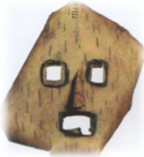
Resim 5. Mansilerde akağaçtan yapılmış ayı bayramı'nda kullanılmıştır.

Yenisey ve Obsk Nehirlerinin aşağı bölgelerinde yaşamış olan Obsk Ugorları (Hantlar ve Mansiler) ayının tayganın iyisi olduğuna inanmaktadır. Ayinlerde kullandıkları maskenin de ayı kültüyle yakından bağlantısı vardır. Anılan halklar ayı şerefine bayram kutlarlar ve kutlamalarda erkekler bu maskeleri takarak ayıyı takdis etmektedirler. Bu bayram, avcılık ekonomisiyle bağlantılı bir bayramdır. Bayram zamanında avcılık oyunları oynanmakta, şarkılar eşliğinde danslar yapılarak ayıya kurban sunulmaktadır. Bu ritüelin icra amacı “tayganın iyisi ayıyı memnun etmek ve avda bol ganimet sağlamaktır”. Bu bayramda taktıkları maskeler esas olarak akağaçtan yapılmıştır. Maske üzerine göz ve ağız için uygun delikler açılmış, burun ise maske üzerine haricen yerleştirmiştir. Maskeyi siyah boya ile boyamışlardır (Resim 5, 6: Vadetskaya 2009: 17).