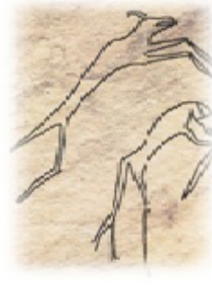
Resim 14. At ve keçi başlı insan resimleri Tas Hazaa Mezarlığı.

Tas Hazaa Mezarlığı. MÖ III. binyıl sonu-II. Binyıl başları.