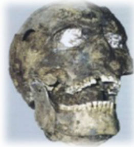
Resim 28. Kil ile sıvanmış mumya kafatası, ağzı kil ile doldurulmuştur. Gözlerde kil üzerinde alçı taşı maske kalıntıları bulunmaktadır.

E. B. Vadetskaya, Çernogor (Karadağ) bölgesinde yaptığı arkeolojik kazıdan elde ettiği buluntular arasında 4 tane kafatası dikkat çekmiştir. Kafatasları üzerindeki ağız ve göz çukurları kil ile doldurulmuştur, kil kalıntıları mevcuttur. Ancak kafataslarından bir tanesine beyaz alçı taşından maske yapılmıştır ve bu alçı taşı maskeden göz çukurları üzerinde alçı parçaları kalmıştır (Resim 28: Vadetskaya 2009: 90). Diğer üç kafatası parlak kırmızı boya ile boyanmış olup, göz çukurları ve yanıklarda boya kalıntıları mevcuttur (Resim 29, 30: Vadetskaya 2009: 90).