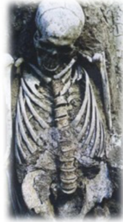
Resim 26. Mumyanın göğsü ve karnındaki ot kalıntıları