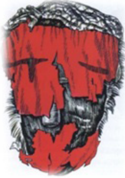
Resim 25. Kukla başındaki ipek.

2004 yılında Belıy Yar (Ak Yar) köyü yakınlarında 1989 yılından beri yürütülen kazı çalışmaları içinde A. İ. Aspelin, dağılmadan kalmış iskeletler bulmuştur (Resim 26, 27: Vadetskaya 2009: 86). Bu iskeletler özel olarak kemiklerin birbirlerine sağlamca pekiştirilmiş mumyalardır. Bu cesetlerin kafataslarını yeniden yapmak için kil kullanmışlardır. Kil ile mumyanın kafasını yeniden yapma tekniği kuşaktan kuşağa aktarılarak, adım adım geliştirilmiş olmalıdır. İlk başlarda kafatasındaki delik ve çukurlar kille doldurulmuş, zaman içinde bu teknik gelişmiştir. Bütünüyle kil ile sıvanmış ilk kafataslarını Klements, Uybat Çaa Tas bölgesindeki kurganda bulmuştur. Ancak sadece kil ile sıvanan mumya kafaları maalesef çok iyi muhafaza olamamışlardır.