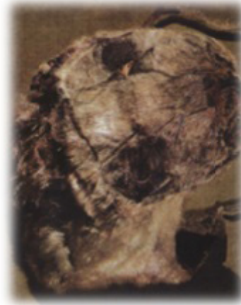
Resim 18. Fok başından yekpare olarak çıkarılan avcı baş giysisi.

Ritüellik maskeler dönemin sanatına da yansımıştır. Kaya plakalar üzerine oyularak yapılmış maskeli figürler ve kayarlardan yontularak yapılmış maskeli idoller bunun göstergesidir (Resim 13, 14, 15, 16, 17).