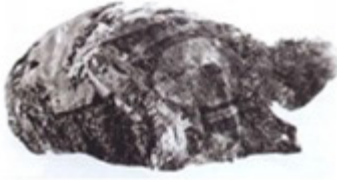
Resim 23. Gümü maskesinin renkli, desenli Çin ipeği ile sarılmış gömü kuklasının ense kısmı. Foto 1903 tarihli İmp. Ark. Komisyonu.