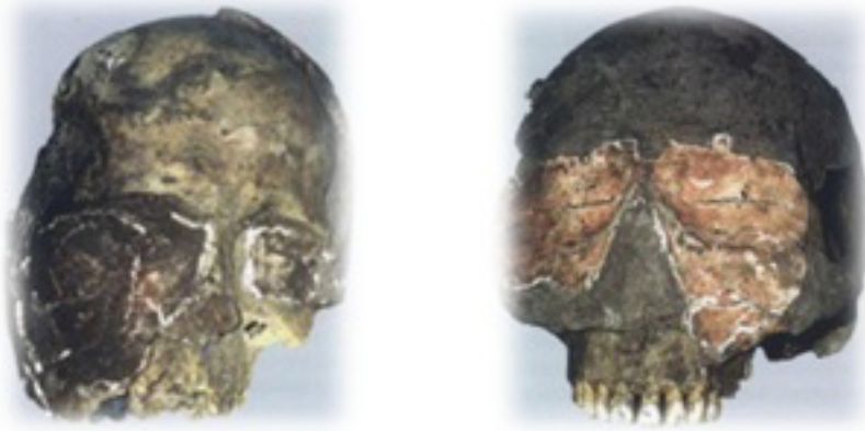
Resim 29, 30. Kafatası üzerine sıvanmış kızıl alçıtaşı maskeler.

Bu konu üzerinde yapılacak çalışmalar, araştırma ve etütler, elde edilecek yeni bulgular bazı noktaları daha iyi aydınlatacak, ama aynı zamanda da yeni bilinmeyenlere dikkat çekecek, çözümler bulunması gereken yeni problemler ve muammalar ortaya çıkaracaktır.