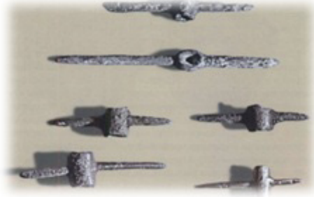
Resim 21. D. A. Klements tarafından Nazarov kurganında bulunmuş, minyatür bronz çekiçler vb., diğer ürünler. A. V. Adrianov tarafından Kızıl Kul kurganından elde edilmiştir.

na yakınında şakaklarda 3x5 cm ölçüsünde delikler açılmıştır. Kafatası kil ile sıvanmış olup, göz çukurları, burun delikleri boyun omurlarının çevresinde kil mevcuttur (Resim 22: Vadetskaya 2009: 60).