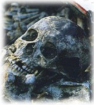
Resim 27. Bely Yar köyü mumya kalıntısı

Kili, kafatasına üstünde ot olduğu hâlde uygulama aşamasına geçmişler, zira bu şekilde kil, kafatasına daha iyi yapışmıştır. Kadim insanlar kafatasını kil ile sıvamakla yetinmemişler ve zaman içinde yüz heykeli-büst yapmasını da öğrenmişlerdir. Bunu da ilk başta bütün olarak kafayı, daha sonra sadece yüz kısmını maske olarak yapabilmişlerdir. Kil ile yapılan bu maske-büstlerin üzerine alçı taşıyla ince katmanlar yapmışlardır. Bu maskeler daha ziyade önemli kişilerin mumyalarına uygulanmıştır.