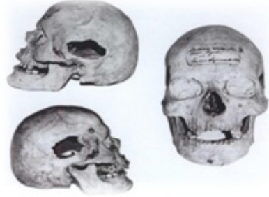
Resim 22. Şakaklarda trepan ameliyat yapılmış Kafatasları. Göz çukurları kil ile dolmuştur. Minüsin müzesi.

“Bu delikler kafatasına ne için açılmıştı?” sorusu hemen akla gelmiştir. Yine bu kafataslarında kille yapılan yüzlerin üzeri alçı taşıyla ince bir katman olarak kaplanmış olduğu ve alçı taşı üzerinde de kırmızı boya ile yapılmış süsleme kalıntıları tespit edilmiştir.