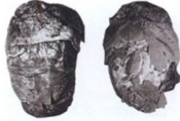
Resim 24-a. Alnında çok renkli ince ipek ile kaplanmış, gömü kuklası yüzü. Foto 1903, İmp. Ark. Komisyonu. -İpekle kaplanmış gömü kuklası yüzü. Otlarla yapılmış ve deri ile dikilmiştir. Deriden burun ve kaş dikilmiştir. Devlet İmparatorluk Müzesi uzmanınca restore edilmiş foto.

Peki bu kuklalar ne amaçla hazırlanmıştır? Adrianov, bu kuklalar içerisinde küçük bir torba içinde özenle yerleştirilmiş külü, kireçlenmiş kemik parçalarını, içine konulan torbanın çürüyerek külün ve kemiklerin dağılmasını tespit etmiş ancak bir anlam verememiştir. Ona göre ceset, kül ve kukla ayrı ayrı olarak gömülmüştür. Oysa hazırlanan bu gömü kukla-manken gerçek cesedi temsil ediyordu; yaktıkları cesedin külünü ise bu kuklanın içine yerleştirmişlerdir, bu yöntemle ölen kişinin ruhu da kül ile bu kukla-mankene yerleşmiştir. İnanca göre ruhun bir bulunma yeri olmalıdır, bu da kukladır (manken).