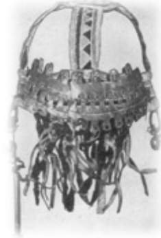
Resim 10. Şaman tacı. Nghanasanlar MAE, kolek. No. 5657-489

Nghanasan şamanlarının baş giysisi olarak ritüelin icrasında taktıkları oldukça zarif bir taçtır. Bu tacın ön kısmında birkaç tane kafa tasviri, demir plakalar ve şeritler sarkıtılmıştır. Bu pandantifler şamanın yüzünü maskeleymektedir (Resim 10: Prokofyeva 2014: 17).