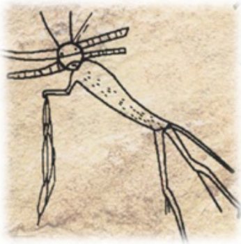
Resim 15. Maske ve kostümlü avcı resmi. Tas Hazaa Mezarlığı.