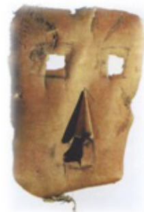
Resim 6. Hantlarda akağaçtan yapılmış ayı bayramı'nda kullanılmıştır.