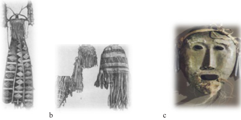
Resim 11. Şaman şapkalrı. Baykal ötesi Evenkleri. Resim 12. Buryatlarda pirinçten hazırlanmış şaman maskesi. a) MAE, no. 1879-21/1; b) MAE, no. 627-4; c) MAE, no. 1855-76.

Udegelerde yüze takılan şaman maskesinin anlamı çok açıktır: maske, şamanın koruyucu ruhunu tasvir etmektedir (Vadetskaya 2009:20). Bu maskeler esas olarak akağaç ve diğer ağaçlardan da yapılabilmektedir. Maskelerin süslenmesi de en az maskenin yapılması kadar önemlidir, çünkü süslenmiş bir maske etkileycilikten uzaktır. Udegeler süslemeleri siyah ve beyaz renklerle yapmaktadırlar. Buryat şamanlarında ise ritüellik maskeler akağaç dışında deri, bakır ve demirden hazırlanmaktadır. Maske, Udegelerde şamanın koruyucu ruhunu tasvir ederken, Buryatlarda şamanın veya onun koruyucu atasının ruhunu tasvir etmektedir (Resim 12).