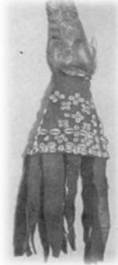
Resim 4. Şaman başlığı. Hakaslar. MAE, No. 5061-11