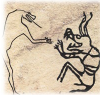
Resim 16. Kayalıklarda ayı maskesi takmış (a, b) insan resimleri.