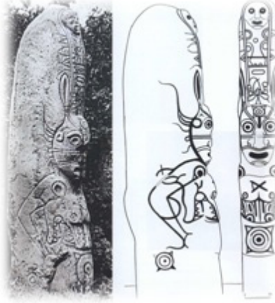
Resim 17. “Şirinskaya baba” idolü. Hakas Cumhuriyeti Müzesi.

girmektedir. Yapılan ayinlerle ve kurban sunularıyla tayganın iyisi “ayı”nın memnuniyeti kazanılmaya çalışılmakta, bunun neticesinde de bol ve bereketli av ganimeti elde edileceğine inanılmaktadır. Yine benzer şekilde Çukça avcılar fok avı zamanında başlarına fok başı derisinden hazırlanan maskeler takmaktadırlar (Resim 18: Vadetskaya 2009: 14). Bunun da elbette ki ilk akla gelen pratik sebebi avlayacakları hayvanları mümkün olduğunca ürkütmemektir.