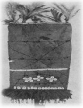
Resim 1. Şamanın baş giysisi. Altaylılar. MAE¹, No. 3973-107.