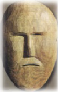
Resim 7. Koryaklarda tahta maske Bayramlarda dinî amaçlarla kullanılmıştır. (Vadetskaya 2009: 18)

Kuzey Altaylı Kumandılar ve Şorlarda ritüellik maskeleri ağırlıklı olarak akağaçtan hazırlanmıştır. Maskeler üzerine ağız, burun ve göz delikleri açılmış ve kimi zaman bu deliklerin çevresini kırmızı boya ile çevrelenerek boyanmıştır. Bu maskeler tanrının oğlu mitolojik Koço’yu tasvir etmektedir.