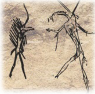
Resim 13. Kuş kostümlü insan resimleri Hakasya.

Kaya resimlerinden de anlaşıldığı üzere dönemin insanları ritüellerinde kuş maskesi, keçi ve at gibi evcilleştirilmiş, ayı gibi vahşi hayvanların maskelerini yapmış ve kullanmışlardır.