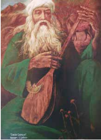
Müzedede Dede Korkut tablosu (Ressam S. Şatikov)

Üç bin yılı geride bırakan bir edebiyatın elbette ki çok sayıda şair ve yazarı olacaktır. Dr. Hüseyinov'un tespitine göre (s. 5), yazılı kaynaklarda kadim devirlerden 21. yüzyıla kadar Azerbaycan'ın dört bine yakın şair ve yazarına tesadüf edilmiştir. Bu rakam, Azerbaycan edebiyatının zenginliğini ispata kâfidir. İşte Nizâmî Gencevi'nin adını taşıyan bu görkemli müze; klasik Azerbaycan şair ve yazarlarının hepsini eserleriyle birlikte bir araya getiren, üç bin yıllık tarihi bir edebiyatın kutsal mekânıdır denilebilir.