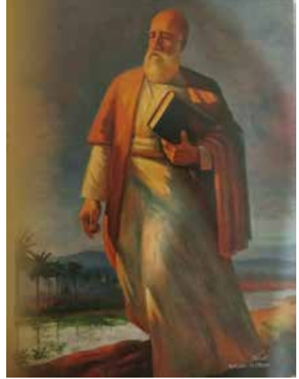
Müzede Fuzulî tablosu (Ressam H. Aliyev)

Ressamlar: Sadıq Şerifzade, Rüstem Mustafayev, Azim Azimzade, Settar Behlulzade, Mikayıl Abdullayev, Büyükağa Mirzazade, Maral Rahmanzade, Necefqulu, Elmira Şahtahtinskaya, Tahir Salahov, Toğrul Nerimanbeyov.