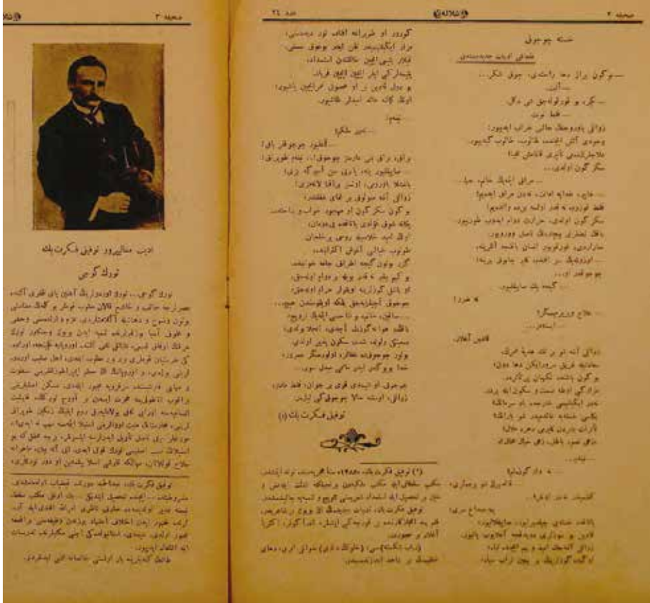
Şelale, No. 24

XX. yüzyıl Azerbaycan basınının önde gelen gazetelerinden biri olan Açık Söz , 2 Ağustos 1915 ve 18 Mart 1918 yılları arasında 704 sayı olarak neşredilmiştir. Edebî, siyasi ve içtimai yayıncılar yapan Açık Söz , önemli bir yazar kadrosunu da bünyesinde barındırmaktadır. Gazetenin yazarlarından olan Mehmed Emin Resulzade gazetenin editörlüğünü de yapmaktadır. Ömer Faik Numanzade, Neriman Nerimanov, Hüseyin Cavid ve Abdullah Şaik gibi Türk dünyasının da önemli isimleri bulunmaktadır. Azerbaycan basının bu önemli gazetesini bizim için de önemli kılan unsurlarından bir tanesi de 1917 yılında, gazetenin editörlerinden biri olan Mehmet Emin Resulzade'nin yazdığı bir makedir.