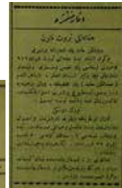
Şekil 4: Tanin , Sayı: 389, 16 Ramazan 1329 / 18 Eylül 1325 / 1 Teşrinievvel [Ekim] 1909, s. 4. Türk Derneği dergisinin 2, ve 3. sayısının çıktığına dair ilan.