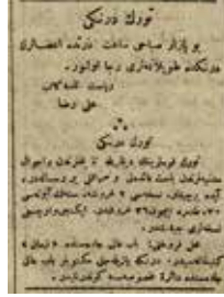
Şekil 3: İkdam , Sayı: 5399, 1 Teşrinievvel [Ekim] 1909, s. 6. Türk Derneği dergisinin 2. ve 3. sayısının yayımlandığına dair ilan.