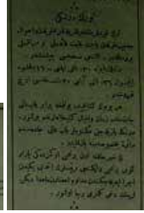
Şekil 7: Tanin, Sayı: 587, 11 Rebiyülevvel 1328 / 8 Nisan 1326 / 21 Nisan 1910, s. 4. Türk Derneği dergisi 6. sayının çıktığına dair ilan.