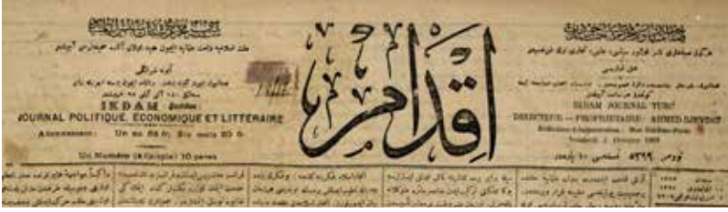
Şekil 2: İkdam , Sayı: 5399, 1 Ekim 1909 başlık klışesi.

6. sayının 21 Nisan 1910'da çıktığını söyleyebiliriz.