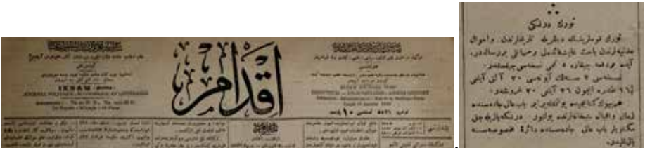
Şekil 6: Türk Derneği , 5. sayının çıkış ilanı. İkdam , 5521, 19 Muharrem 1328 / 18 Kânunusani 1325 / 31 Kânunusani 1910.

Türk Derneği'nin 5. sayısının çıktığı da 19 Muharrem 1328 / 18 Kânunusani 1325 / 31 Kânunusani 1910 tarih ve 5521 sayılı İkdam'da (s. 5) benzer bir ilanla duyurulmuştur: