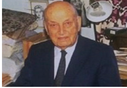
Şair, Araştırmacı, Biyografi Yazarı Ö. Taha Toros

(Türk Dili, C. 14, S. 164, 5/1965, s. 563)