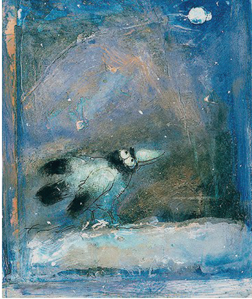
Resim: Mustafa Delioğlu

Kitaplarca genç editörler, alanın bunca sorunuyla da başa çıkabileceklerdir elbet. Çünkü çorbada tuzu olmanın tadı neyle değişilebilir ki!