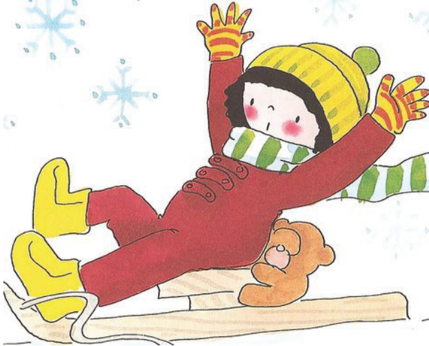
Resim: Gamze Baltaş

100 Temel Eser listesindeki kitapların bazıları, beklenen ilgiyi görmemiştir. Burada ilgili kuruluşun satış stratejileri de etkili olmuş olabilir. Özellikle telif sıkıntısı olmayan kitaplar, piyasada daha fazla yer almaktadır.