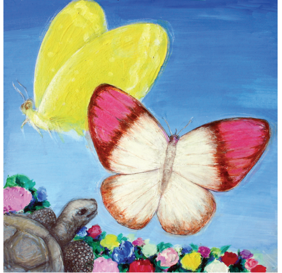
Resim: İsmail Kaya

Giderek televizyonun yerini alan bilgisayar kullanımı okul öncesi çocuğunun ilgi alanını çok farklılaştırmıştır. Bilgisayar, tablet ortamında çocuk İnternet'e girmekte, oradan çizgi film izlemekte, televizyon seyretmekte, müzik dinlemektedir, etkileşimli programlarda oyunlar oynamaktadır. Sosyal medya ile ilişkiler de bilgisayar ve cep telefonu aracılığıyla başlamakta, giderek cep telefonu bilgisayarın yerini almaktadır. Çocuğun bu araçlara bağımlılığı giderek daha da artmakta, sosyalleşme yerine çocuk sanal bir dünyaya kapanmakta, bağımlılık yer yer tedaviye muhtaç bir hastalık hâlini almaktadır.