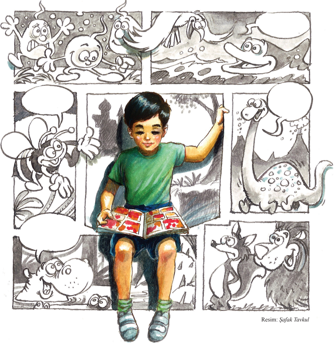
Resim: Şafak Tavkul

Umutsuzluğu yakıştıramıyorum kendime. Ama edebiyat genelinde de, çocuk ve ilk gençlik edebiyatı özelinde de Batı’nın ta beş yüz yıldır giyindiği özgürlüğü -neye mal olursa olsun- alıp giyinmedikçe nitelikli eleştiri asla mümkün değil.