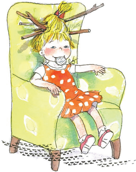
Çizgi: Saadet Ceylan

Aile, ekranlardan daha sıcak ve cezbedici oyunlar oynayabildiğinde, çocuklar, babalar, anneler masal anlatmaya başladığında, sevinç geriye dönecektir. Çocuk edebiyatı yıldızlı gökyüzünü kapatan perdeyi açtığında, kuşların meramı anlaşıldığında çocukluk çocuğa dönecektir.