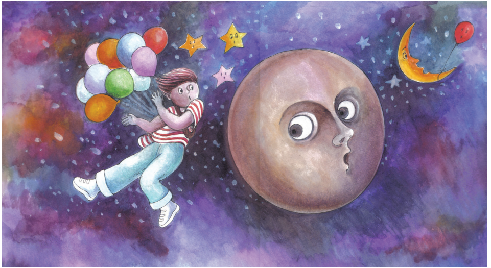
Resim: Nural Bırden Akca