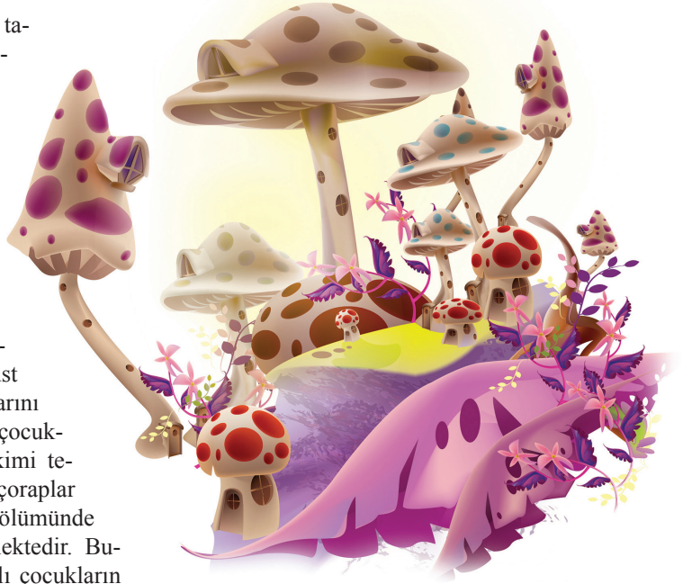
Çizgi: Bekir Gürgen

Noktalama işaretleri ve yazım kurallarıyla ilgili olarak belki bir sıkıntı oluşabileceği düşüncesindeyiz. Özellikle ilkokul çağındaki çocukların bu kullanımları benimseyip uygulamaları söz konusu olabilecektir. Ortaokul dönemindeki çocuklar ise dil kullanımındaki bu değişiklikleri fark edebilirler.