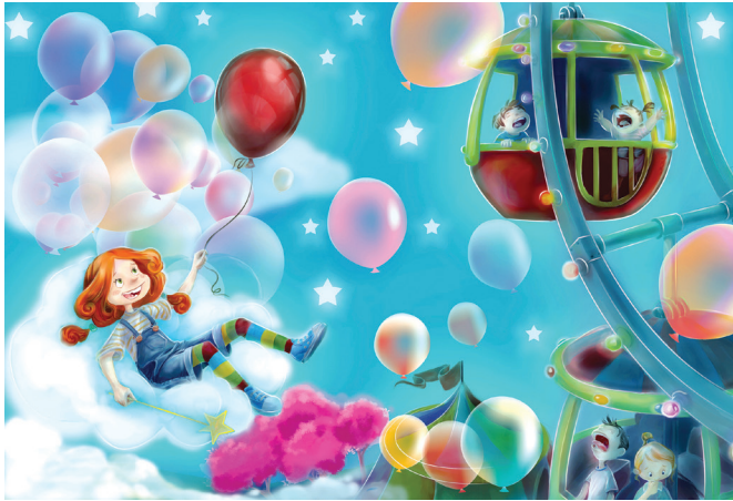
Çizgi: Bekir Gürgen

Çocuklarımızın nitelikli okur olmaları için bu tür nitelikli çocuk kitaplarına gereksinim var. Ayrıca popüler kültür, çocuk kitaplarından daha etkilidir; bu tür kitaplar popüler kültürü sarsacak bir etki de bırakabileceğinden önemsenmelidir.