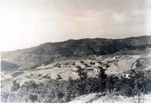
Kılıç Mahallesi'nin kuruluşu: İşçi evleri.