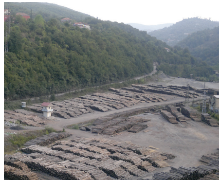
Karadon'daki bir direk harmanı.

1878’de havzadaki ocaklara numara verilmeye başlanır. Bu tarihten önce ocaklar ocağı açan ve işleten kişinin adıyla anılmaktadır. Bölgede bugüne kadar üç yüz doksan civarın-