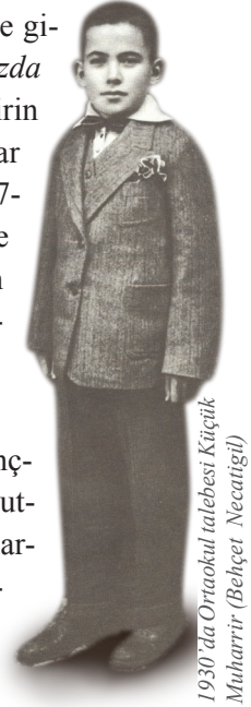
1930'da Ortaokul talebesi Küçük Muharrir (Behçet Necatigil)

Bazı şair ve yazarlar, değil çocukluk yazılarını gençliklerinde yazdıklarını bile hatırlamak istemez; onları unutmayı tercih eder hatta unutturmaya çalışır. Necatigil onlardan değildir. Edebiyata ilgisinin nasıl başladığı yönündeki soruları cevaplarken "Küçük Muharrir Dönemi"ni milat olarak belirleyip ayrıntısıyla anlatır. Örneğin