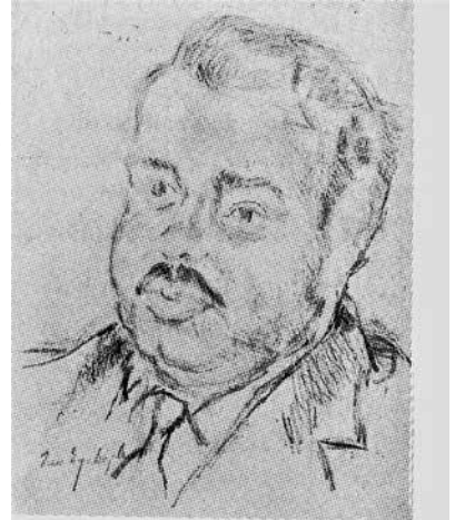
Asaf Hâlet Çelebi

Sanat dünyasında zaman zaman tartışılan sanat eserinde sanatçının adının ve imzasının gerekli olup olmadığı konusu, eseri halka mal et-