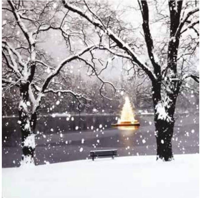
Christmas Tree on the Lake, Q. Elizabeth's Found

gibi toplu kutlamalar gerçekten çok tatsız bir şaka gibidir. Büyük bir özenle yazılmış, dikkatle zarfına pul yapıştırılmış ve postalanması için bir zaman ayrılmış; içine sevgilerimizi, saygılarımızı, aşklarımızı, hasretlerimizi, dua, dilek ve temennilerimizi doldurup gönderdiğimiz mektup ve kartpostalların yanında başında adınızın bile bulunmadığı sıradan, hatta kopyala yapıştır metoduyla oluşturulmuş klişe laflarla dolu bir SMS mesajının ne değeri olabilir ki!..