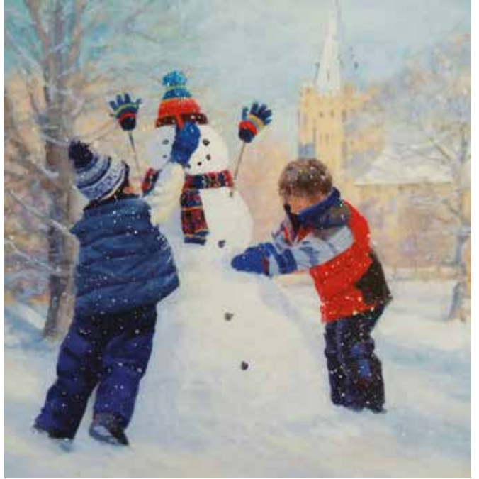
Building a Snowman, Brit. Heart Foundation