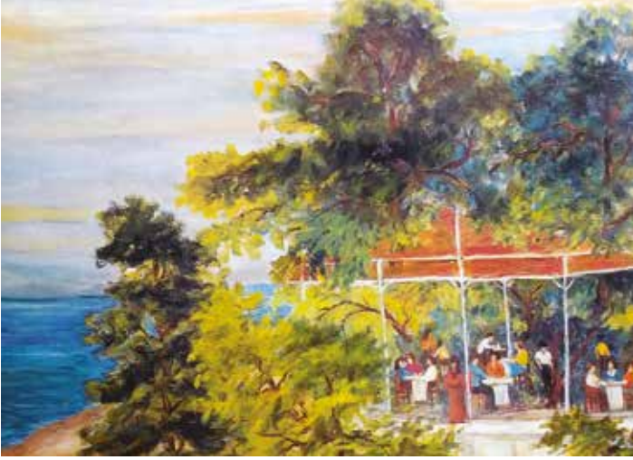
Ressam Nermin Pura'nın bir kartpostalı

leneğinin azalmasıyla birlikte zarflara pul yapıştırma geleneği de neredeyse yok olup gitmişti. Daha da acısı, bununla birlikte çocukluk yaşlarımızdan başlayan pul koleksiyonculuğu gibi çok güzel, faydalı ve koleksiyonerleri başka sahalara da yönlendirici, zamanı ve geleceği değerlendiren bir hobi, bir gelenek de neredeyse unutulup gitmişti.