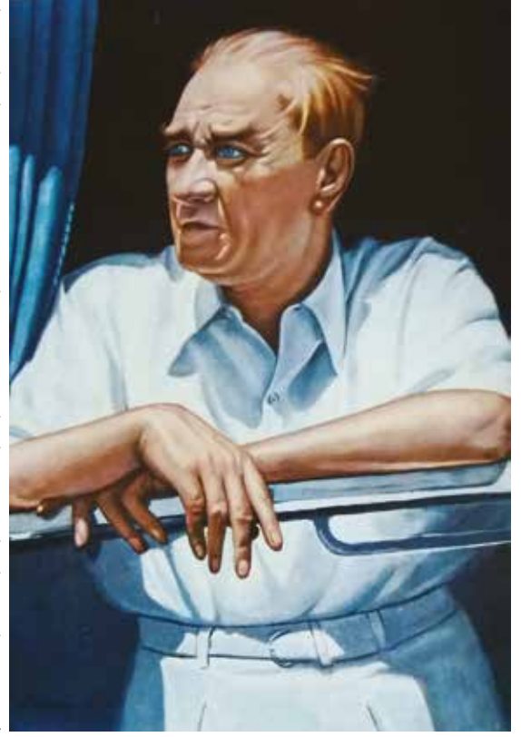
Atatürk kartpostallarından biri, Keskin Color

Geçenlerde İngiltere'deki arkadaşlarıma göndereceğim kartları hazırladıktan sonra postaneye gidip zarfları görevli memura uzattığımda o, her zaman yaptığı gibi zarfları makineden geçirmek üzereyken onu durdurup kendinden pul rica ettim çünkü artık mektup ve kartpostal gönderme ge-