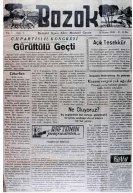
Bozok gazetesinin ilk sayısının birinci sayfası.

1954'te İstanbul'da matbaacılığa dayalı üç ayrı iş yeri vardır ve Yozgat'ta Bozok gazetesini, Yerköy'de de Yerköy Gazetesi ve matbaasını kurar. 1957 seçimlerinde aday adayı olur. Adaylığının kabul edilmemesi üzerine politikadan ömür boyu uzaklaşır. 1955 yılından itibaren gazetesinde yayınladığı şiirlerini