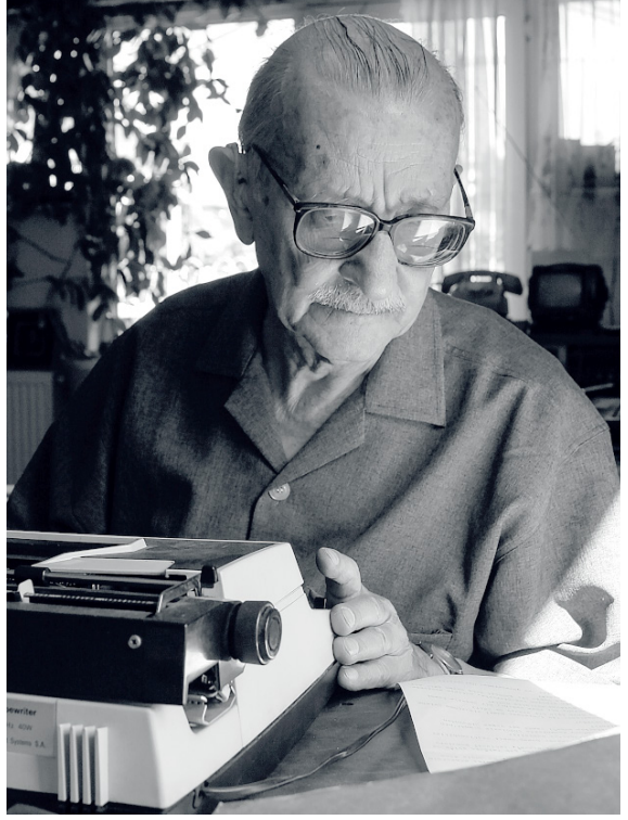
Bir Başka Hoca: Orhan Kitabı (Zeytinburnu Belediyesi Kültür Yayınları, İstanbul 2023) adlı eserden alınmıştır.

Hocamızın bir başka yönü de Türk müziği alanındaki enjin kültürüydü. Keşke onu bu yönüyle yakından tanıyan bir uzman, mesela edebiyat ve musiki bilimlerinin seçkin ismi Nesrin Feyzioğlu, Okay’ın klasik Türk müziği zevki, kültürü ve birikimi üzerine bize bilgiler verebilse. Çok zengin ve şaşırtıcı bir dünya ile karşılaşacağımızdan eminim. Kendi adıma, Feyzioğlu’nun aktarımıyla hocamızın uşşak, saba ve bestenigâr makamlarını çok sevdiğini biliyorum. Sevdiği makamlardan hareketle Okay’ın mizacı hakkında yo-